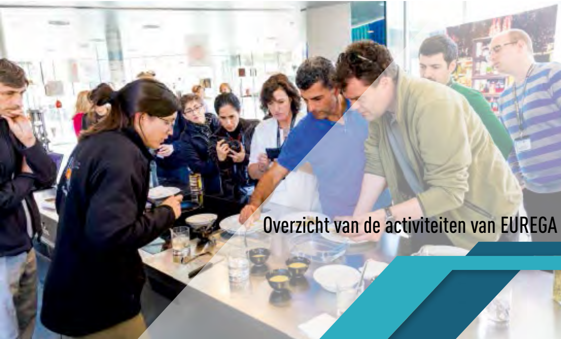
Overzicht van de activiteiten van EUREGA